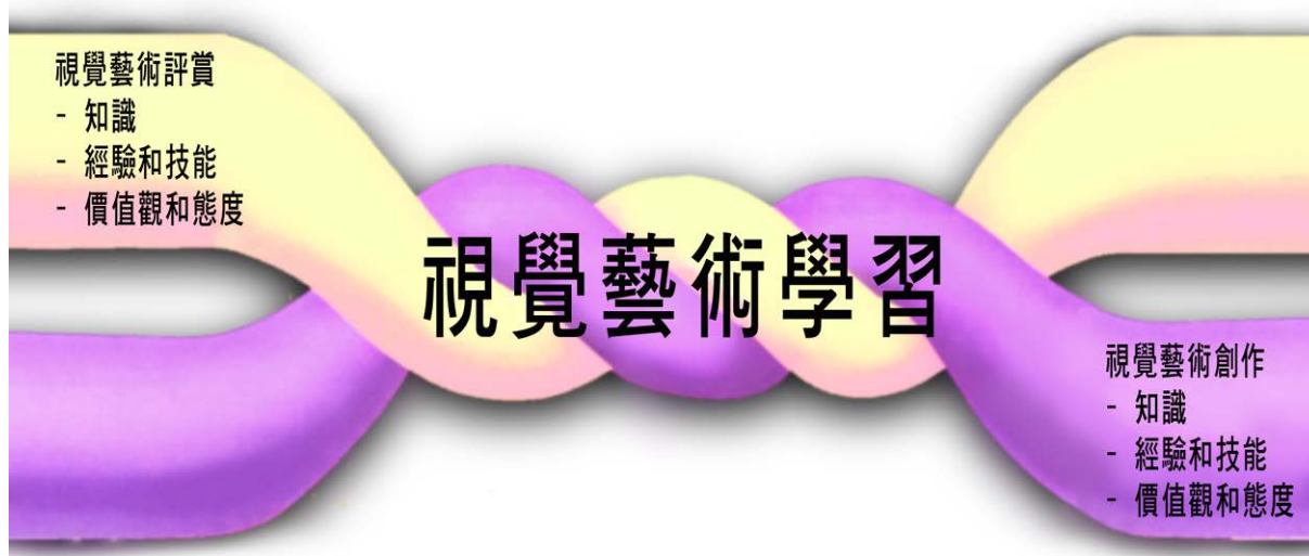
圖2.2 視覺藝術科的兩個學習範疇

視覺藝術科課程可以使學生建構出範圍廣闊的知識，例如對事實及資料的了解、概念、實踐知識、個人信念、視點、領悟；掌握經驗及技能；以及培養價值觀和態度。學生可以透過一個結合了 視覺藝術評賞 和 視覺藝術創作 兩個交錯纏結的範疇的均衡課程，來學習藝術。由於這兩個範疇的關係十分緊密，因此須以綜合統整的方式學習。圖2.2展示這兩個學習範疇的關係。